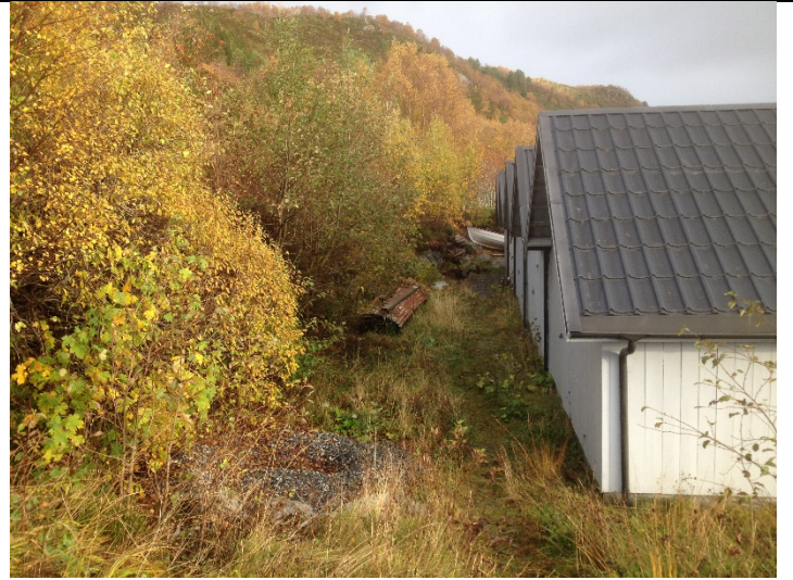
Figur 20: Området bak naustrekka.