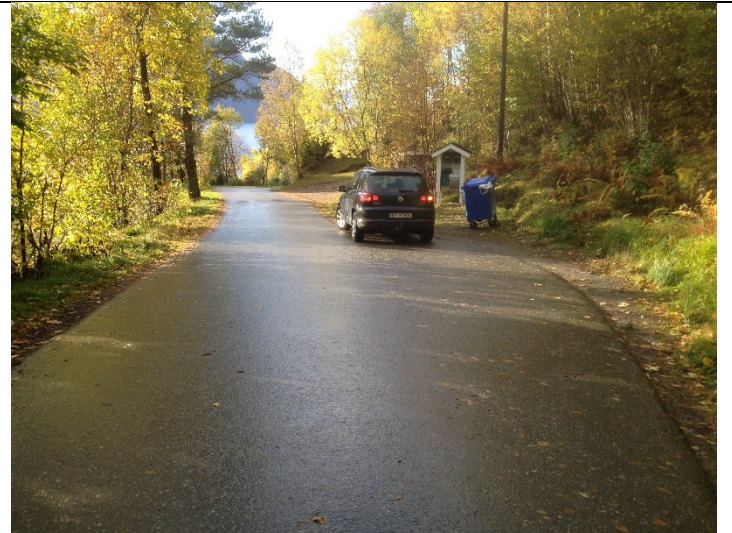
Figur 4: Almestranda frå avkøyrslе og vestover.