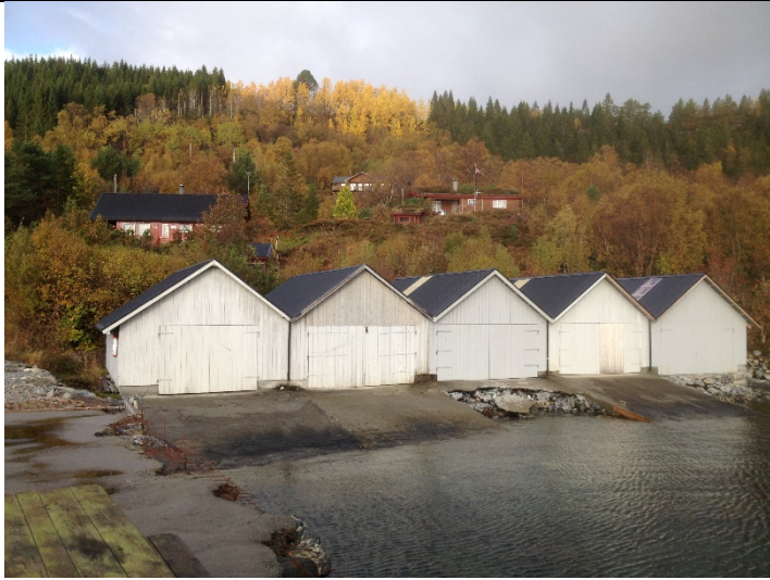
Figur 19: Naustfront – frå enden av molo.