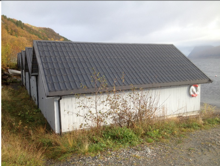
Figur 21: Naustrekka frå sida.