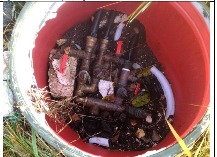
Figur 12: Fordelingskum for vatn.