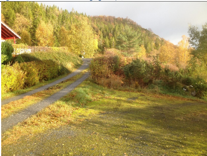
Figur 17: Nordaustover mot enden av internveg.