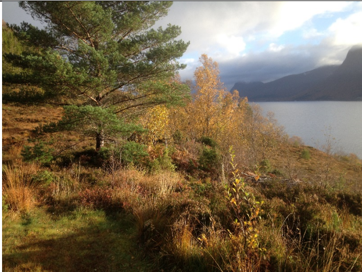
Figur 15: Frå enden av internveg og aust/søraust.