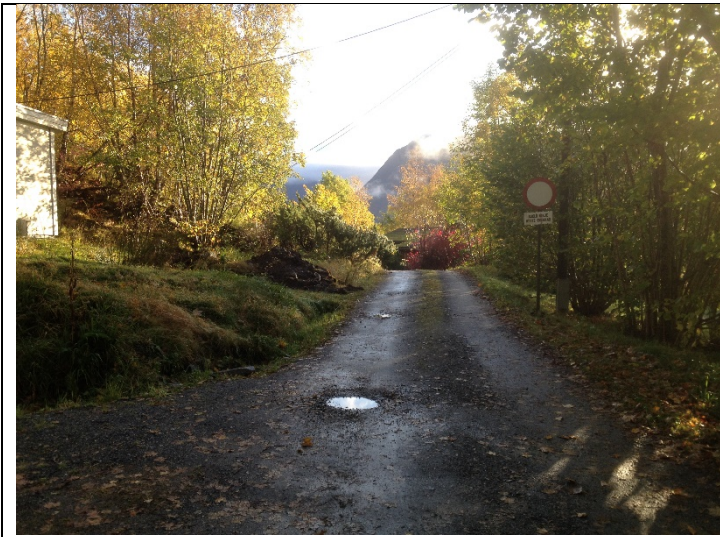
Figur 7: Tilkomsvegen til hyttene.