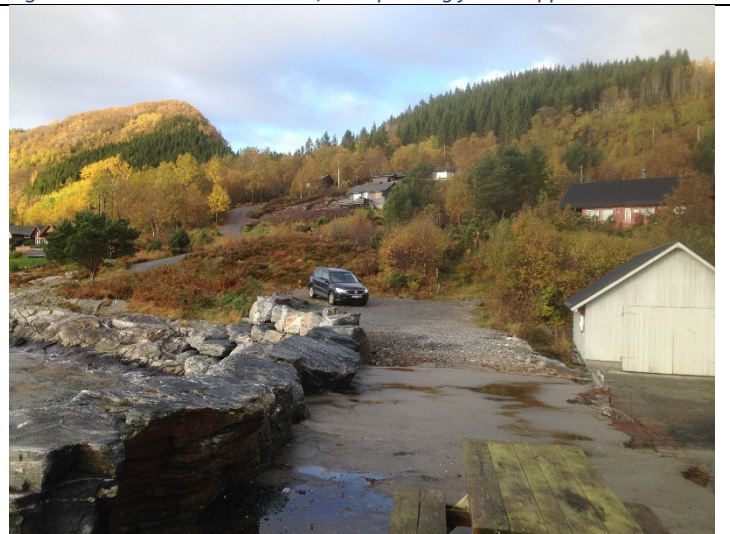
Figur 24: Nordvestover frå enden av molo.