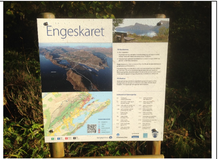
Figur 8: Informasjonstavle ved inngangen til feltet.