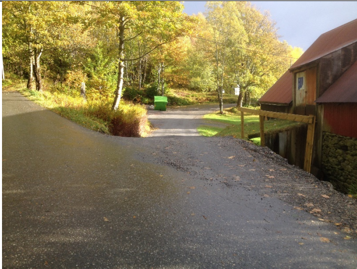
Figur 3: Eksisterande avkøyrslе.