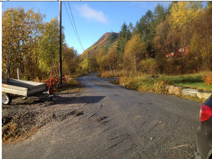
Figur 9: Internvegen i retning vest.