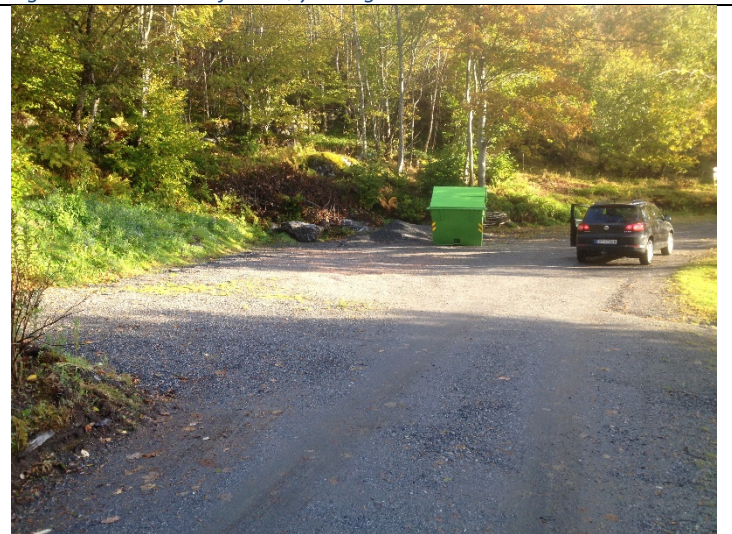
Figur 6: Parkeringsplass og avfallskontainer for hyttefeltet.