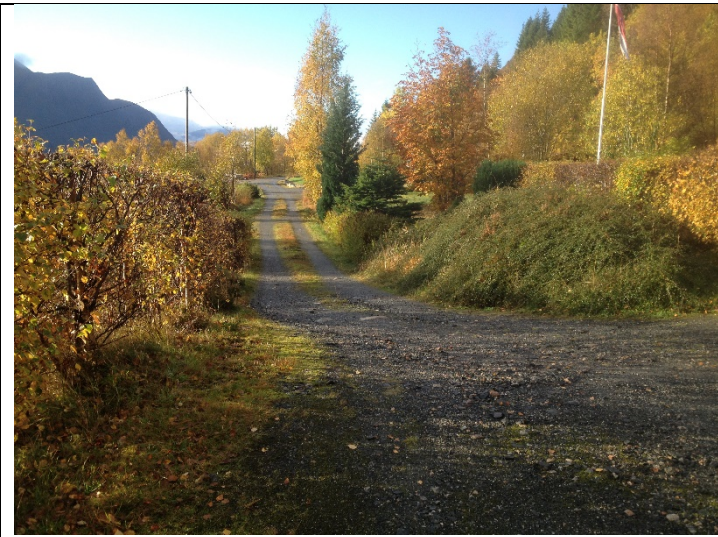
Figur 13: Frå enden av internveg og sørvestover.