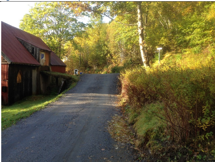
Figur 5: Eksisterande avkøyrslе sett mot Almestranda.