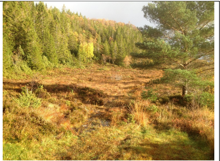
Figur 14: Frå enden av internveg og austover.