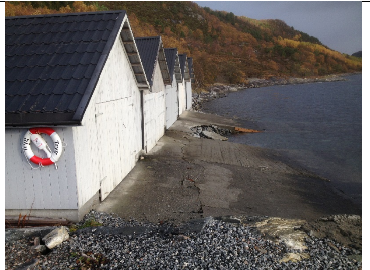
Figur 22: Fronten av naustrekka, med platting for båtopptrekk.