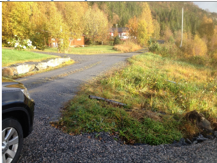
Figur 11: Frå avkøyrsla til nausta og austover mot enden av vegen.