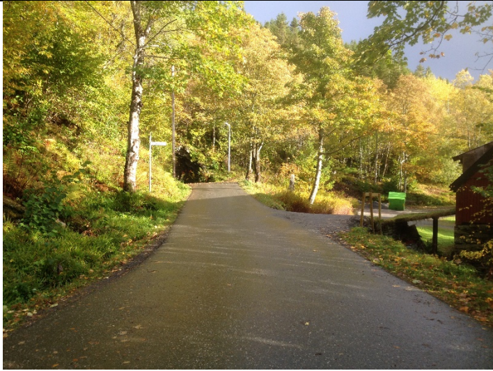
Figur 1: Frå Almestranda i retning tunnel. Eksist. avkøyrslе til høgre.