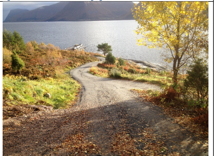
Figur 18: Den bratte vegen ned mot naustområdet.