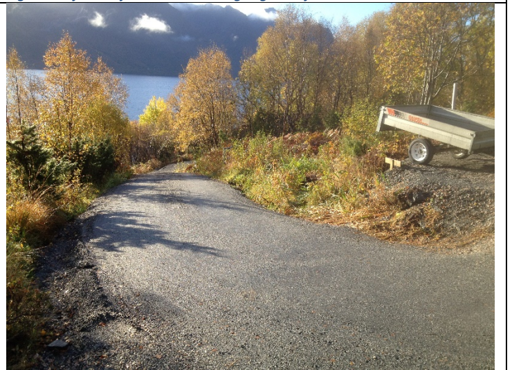
Figur 10: Den bratte (1:4) vegen ned mot naustområdet .