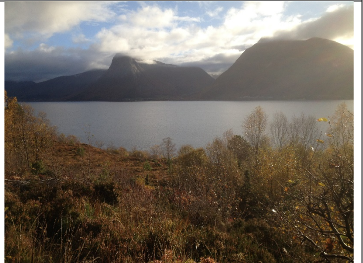
Figur 16: Frå enden av internveg og søraustover.