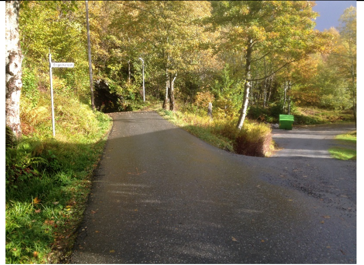
Figur 2: Eksisterande avkøyrslе frå Almestranda.