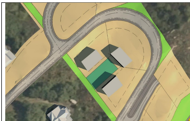
Figur 6: 21.juni kl.09.