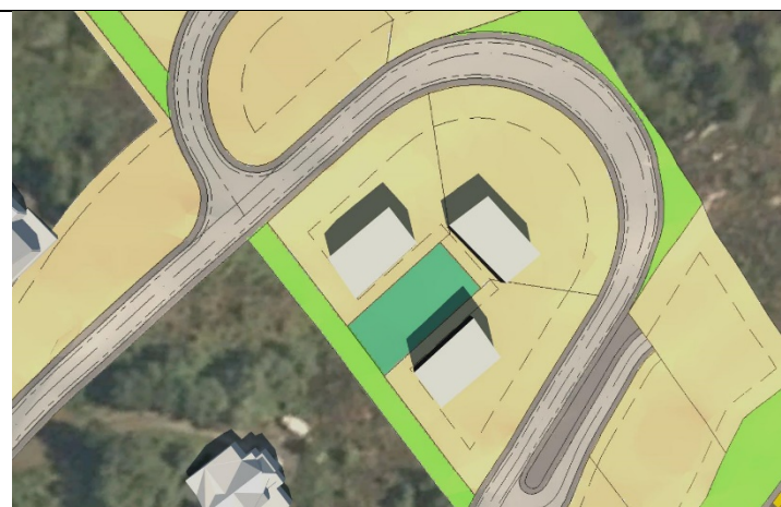
Figur 7: 21.juni kl.12.