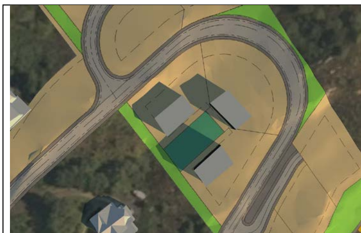
Figur 1: 20.mars kl.09.