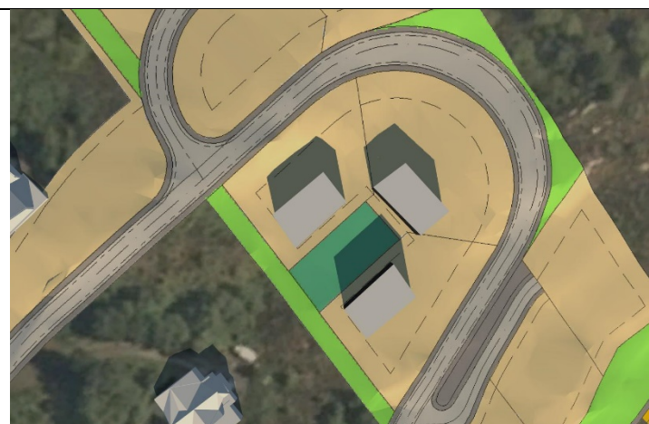
Figur 2: 20.mars kl.12.